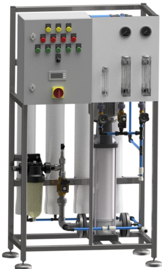
EKO OSMO 24K

Oferowane systemy RO produkujemy na podstawie wykonanych przez nas projektów w oparciu o nasze wieloletnie doświadczenie. Wykonujemy również projekty według wytycznych inwestora (OEM), tak, aby jak najlepiej dostosować parametry stacji do oczekiwań klientów.